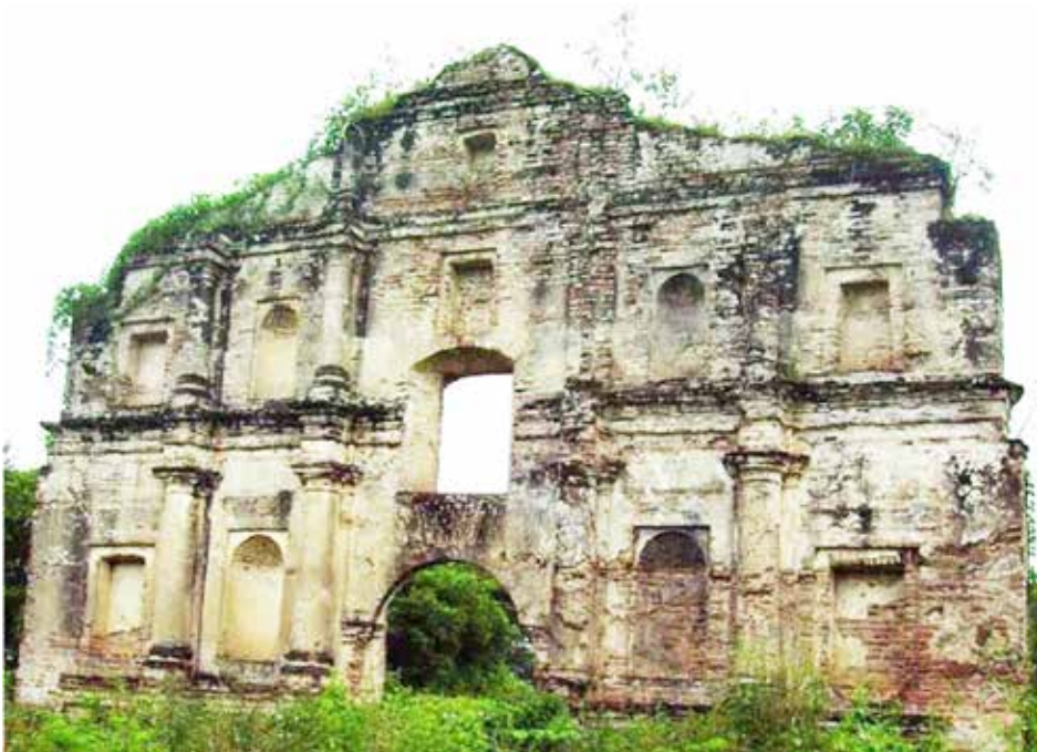
Foto 1. Fachada de la antigua iglesia de Ostúa