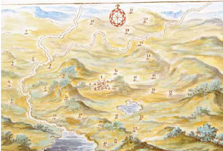
Mapa tomado de PARES. Portal de Archivos Españoles.

Fuente: https://pares.culturaydeporte.gob.es/inicio.html